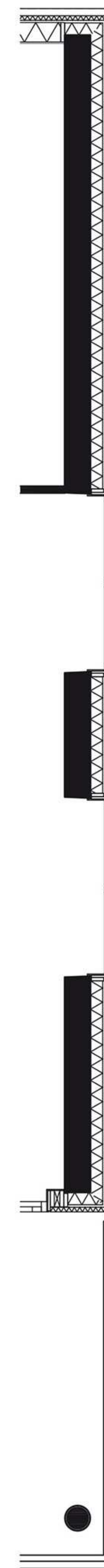
Gevelfragment t.p.v. bouwnummers 22, 26 en 30